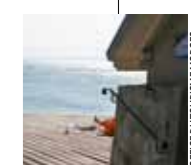
IDYLLIQUE Discretion et confort.