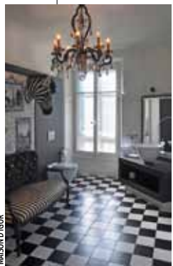
STYLE Huit chambres au caractère unique de par leur décoration.