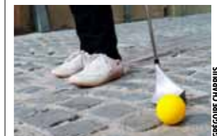
BALADE Un parcours qui marie pavés, parcs et quais jusqu'à Préverengres.

ce qu'il choisisse de tout quitter pour se lancer en tant que pêcheur professionnel sur le Léman. Sa plus grande fierté? La féra fumée à froid. «Le filet est levé, désarêté, puis salé au gros sel, rincé, mariné aux épices pendant une nuit avant d'être fumé pendant vingt heures à 16 °C», explique-t-il. Une technique qui permet d'obtenir un filet similaire au saumon fumé, raffiné et tendre. Parmi les autres merveilles du comptoir: la pêche du jour (ombles, truites, perches, brochets, écrevisses, lottes) mais aussi des filets de féra fumés à chaud, du brochet fumé à froid au vin cuit et poivre noir, des mousses de lotte au chasselas, de féra au piment d'Espelette, de brochet au citron et