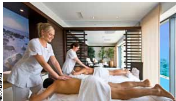
EXCLUSIF Sauna, hammam, massage... dans un vaste espace pour deux.